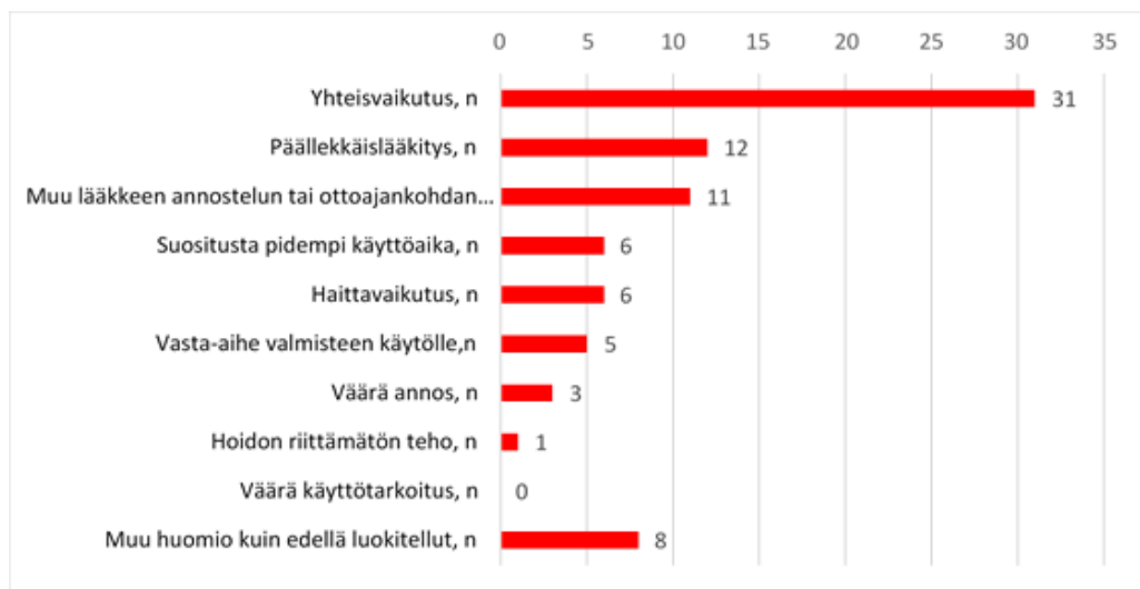
Kuva 2. Itsehoitovalmisteisiin liittyneet huomiot (n=51). Samassa vastauksessa voi olla useampiakin huomioita.

Vaikka kahdessa kolmasosassa Lääkityksen tarkistuspalvelun tietokantatarkistuksia ei löytynyt potentiaalisia lääkehoidon ongelmia, Lääkityksen tarkistuspalveluprosessi ei ollut turha. Asiakkaiden saamalla varmistuksella siitä, että heidän lääkityksensä on kunnossa, on suuri merkitys asiakkaalle ja auttaa sitoutumaan lääkehoitoon (Hatah ym. 2014, Twigg 2016). Lisäksi 88 prosentissa tapauksista tehtiin muita kuin varsinaisia tietokantapohjaisia tarkistushuomioita. Näiden havaintojen suuri määrä osoittaa, että lääkityksen tarkistaminen on muutakin kuin mekaanista työtä. Esimerkiksi lääkehoidon tavoitteen epäselvyys asiakkaalle tai koettu tehon puute selviää vain keskustelemalla asiakkaan kanssa. Muut kuin varsinaiset, tietokantojen perusteella esiin tulleet tarkistushuomiot, johtivat usein tarpeeseen ohjata asiakas lääkäriin. Tämä johtui siitä, että varsinaisiin tarkistushuomioihin, kuten lääkkeiden ottoajankohtiin, liittyvät ongelmat voidaan usein ratkaista jo apteekissa, mutta lääkehoidon teho- ja tavoiteongelmat vaativat aina lääkärin konsultaatiota.