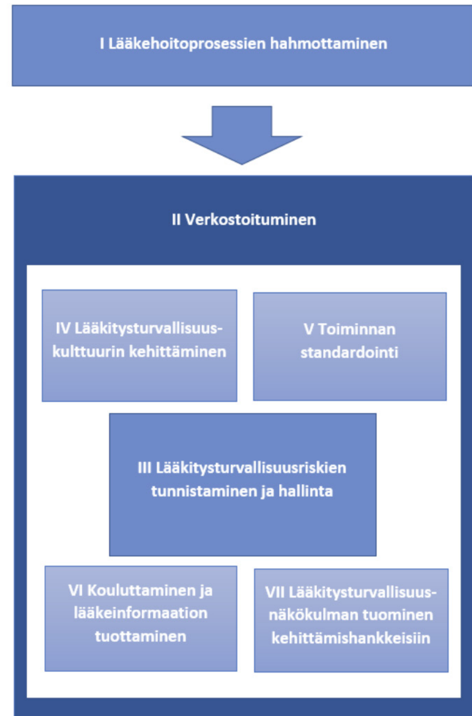
Kuva 3. Lääkitysturvallisuuskoordinaattorille ehdotetut päätehtäväalueet.